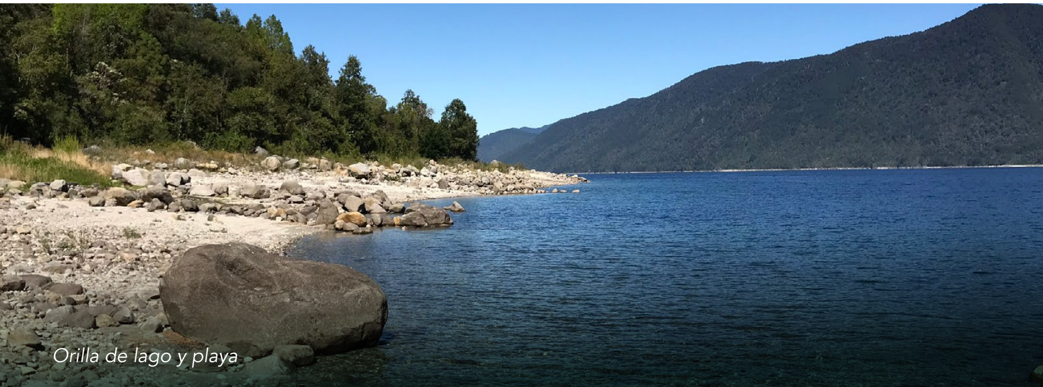
Orilla de lago y playa

IMPONENTES VISTAS AL VOLCÁN VILLARRICA Y AL LAGO