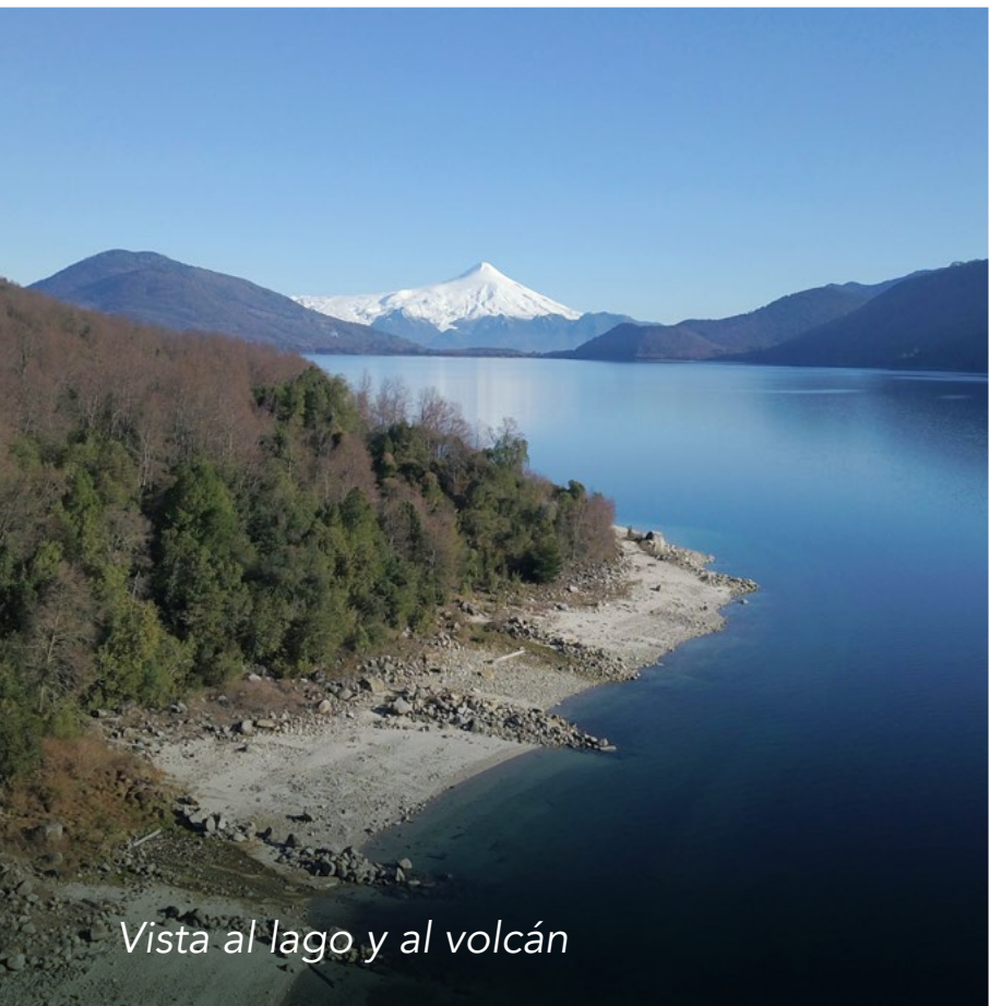
Vista al lago y al volcán