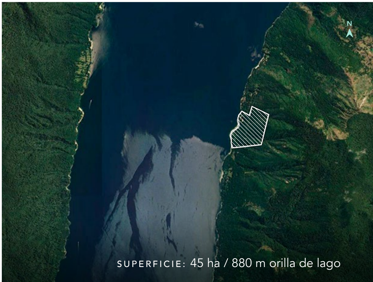
SUPERFICIE: 45 ha / 880 m orilla de lago