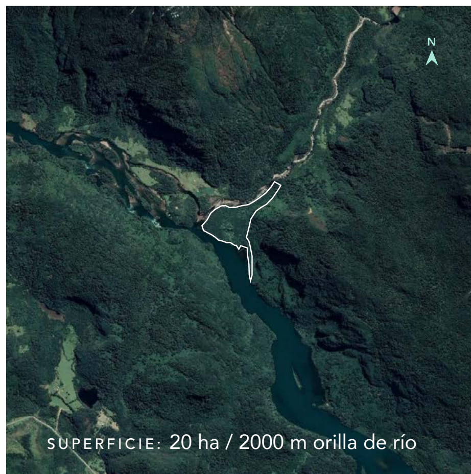
SUPERFICIE: 20 ha / 2000 m orilla de río