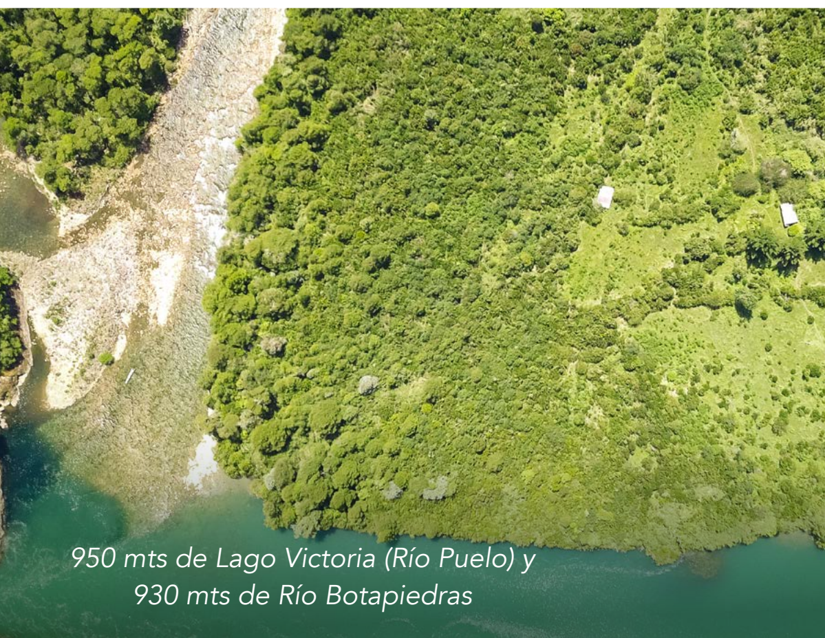
950 mts de Lago Victoria (Río Puelo) y 930 mts de Río Botapiedras