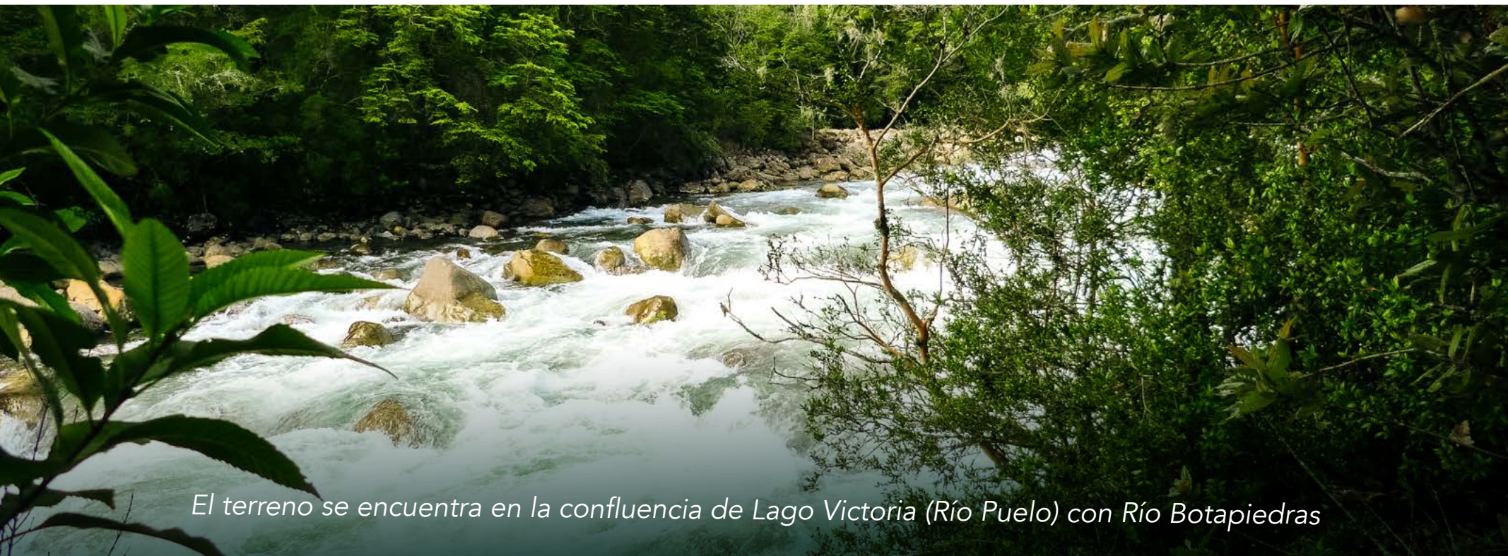
El terreno se encuentra en la confluencia de Lago Victoria (Río Puelo) con Río Botapiedras

Considerado uno de los mejores destinos del sur de Chile para la pesca deportiva y actividades como kayaking, trekking, montañismo, biking, cabalgatas, etc.